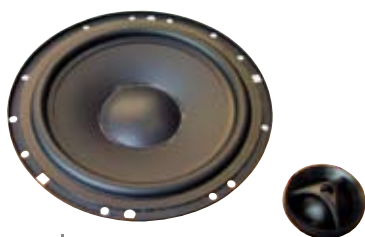
morel Tempo 6 ¥57,750 ※通常はネットワーク同梱

カロツェリアの上位ブランド、カロツェリアXシリーズの技術と思想を受け継ぐDSPメインユニット。マルチスピーカーシステムに対応する高品位な別体アンプも同梱した、高音質系の新たなリファレンスモデル。iPodやUSBデバイスなど、外部機器との接続・再生も可能です。