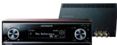
carrozzeria DEH-P01 ¥105,000

車の中では、いい音を聴きたい— そんなあなたを夢中にさせる、 かつてない3Wayシステムのご紹介です。